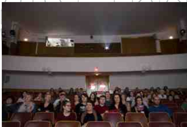
Jeden sv t Police nad Metují 2017 Záv re ná zpráva